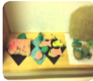
粘土作品! 「こいのぼり」