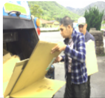
リサイクル班「ペース」